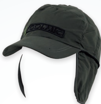
GREEN CAP WITH EARMUFFS CASQUETTE VERT AVEC PROTÈGE OREILLES