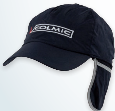
BLUE WATERPROOF WINTER CAP CASQUETTE D'HIVER IMPERMÉABLE BLEU