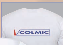
REAR LOGO MARQUE DERIÈRE