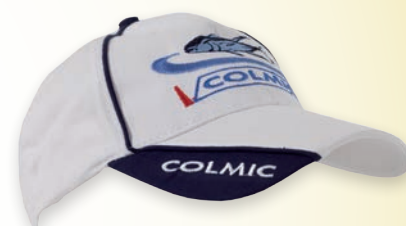
COTTON SUMMER WHITE CAP WITH TUNA CASQUETTE EN COTON BLANC AVEC THON