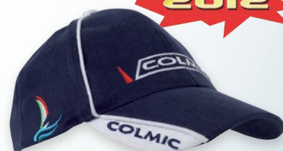
BLUE WINTER CAP CASQUETTE D'HIVER BLEU