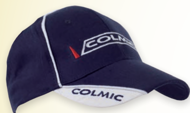
COTTON SUMMER BLUE CAP CASQUETTE EN COTON BLEU