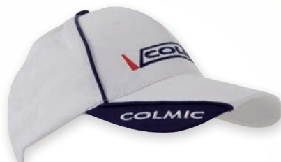
COTTON SUMMER WHITE CAP CASQUETTE EN COTON BLANC