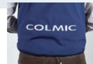
REAR LOGO MARQUE DERIÈRE