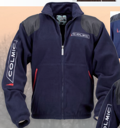
ZIPPED FLEECE PULL PULL EN POLAIR AVEC FERMETURE ÉCLAIR

Très beau sweat shirt en coton étudié pour tous vos besoins. C'est un vêtement très confortable, adapté à toutes les activités sportives ou aux loisirs. Grâce à sa fermeture-éclair sur le devant, elle offre une bonne protection contre le froid et le vent. Pourvue d'une bande élastique à la taille et aux poignets, ce sweat shirt garantit un parfait tombé.