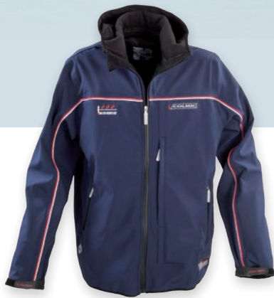
BLU SOFTSHELL JACKET VESTE SOFTSHELL BLU