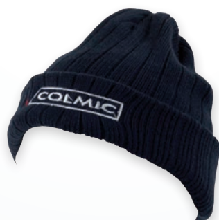
COLMIC BLUE SKULL-CAP BONNET COLMIC BLEU