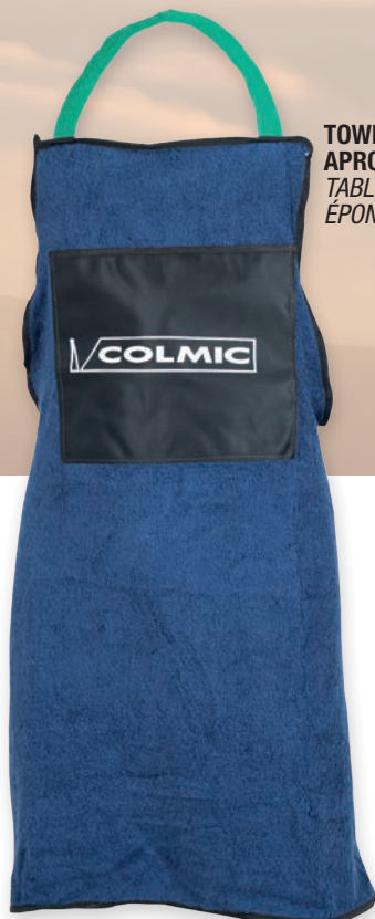
TOWELLING APRON TABLIER EN ÉPONGE