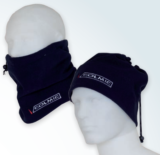
PILE NECK WARMER CHAUFFE COU EN POLAIR