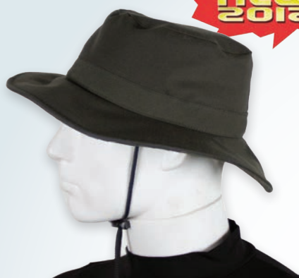
GREEN WATERPROOF HAT CASQUETTE VERTE ANTI-EAU