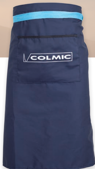
COTTON APRON TABLIER EN COTON