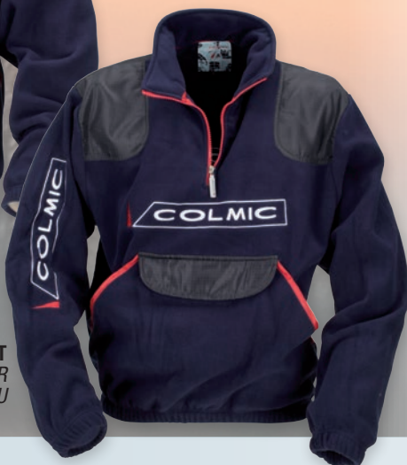
FLEECE PULL WITH FRONTAL POCKET PULL EN POLAIR AVEC POCHE KANGOUROU